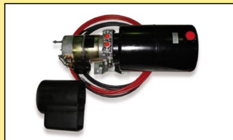
Elektrohydraulisches Stromaggregat umweltfreundlich