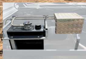
Serbatoio + blocco valvole