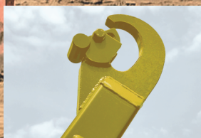
Gancio di sollevamento

Il famoso montaggio Titan ha già tanti estimatori nel segmento degli autocarri medi e pesanti e non intende mollare. Con il montaggio imbullonabile Titan, infatti, montare l'impianto scarrabile a gancio è un gioco da ragazzi. Titan dispone inoltre di kit specifici per il telaio, che permettono l'aggancio ottimale di autocarro e scarrabile.